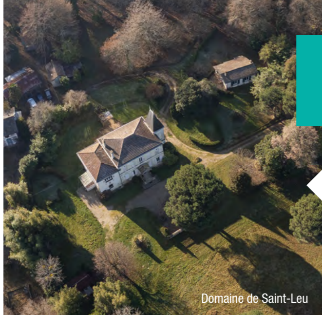
Domaine de Saint-Leu