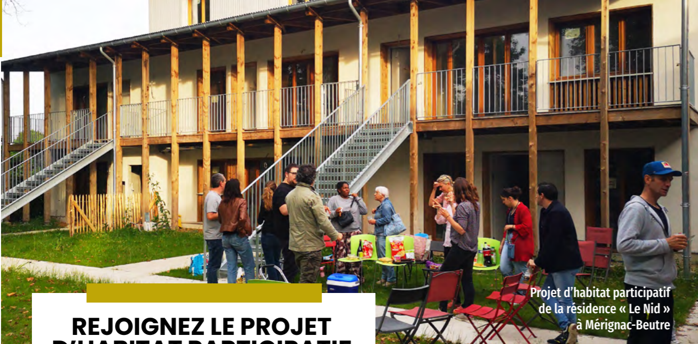
Projet d'habitat participatif de la résidence « Le Nid » à Mérignac-Beutre